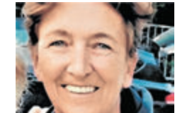
Liane Karlhofer design Textilien.